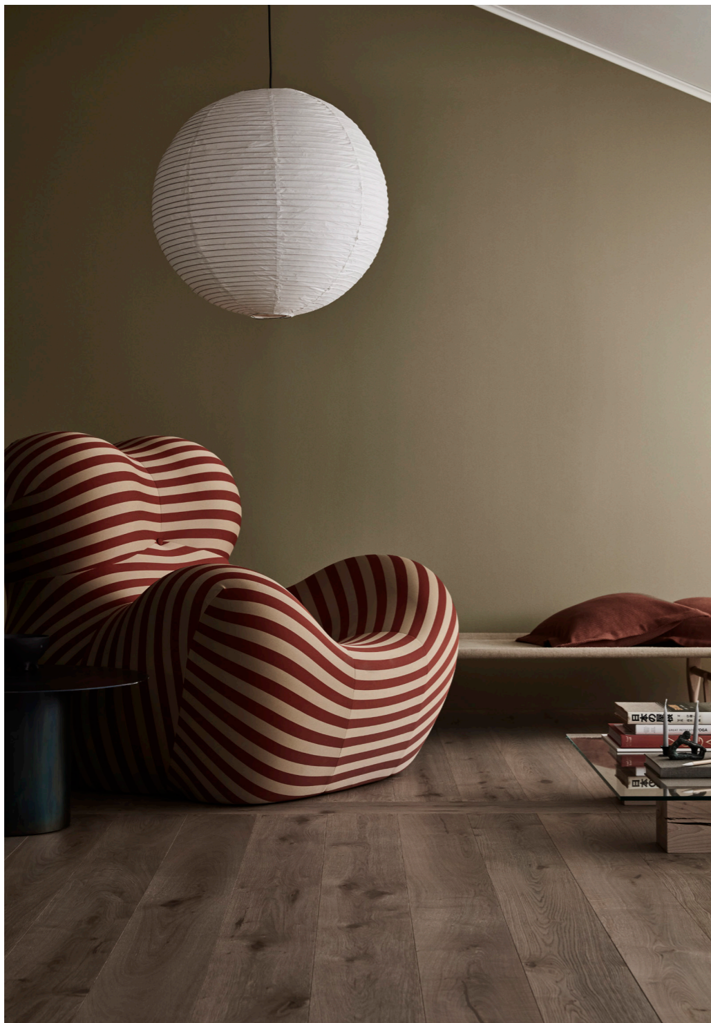
TAMMI OLD VINTAGE MOONSTONE