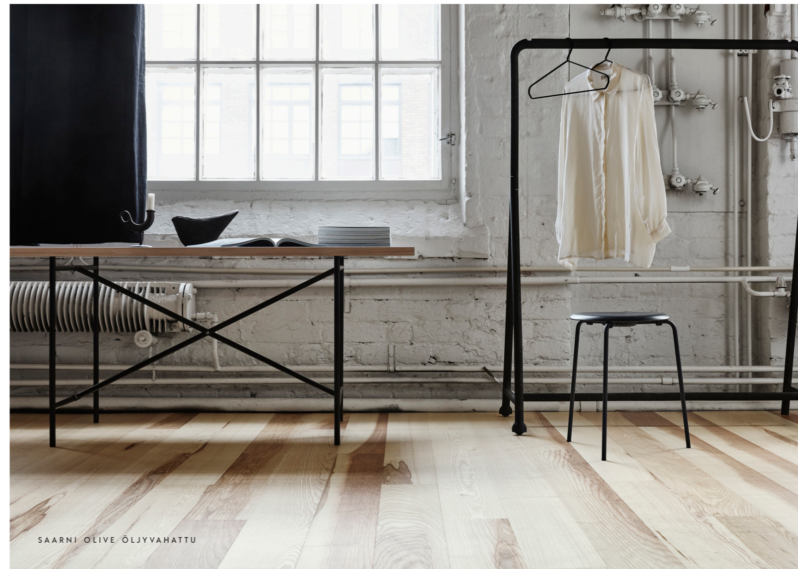
SAARNI OLIVE ÖLJYVAHATTU

Puulattia reagoi auringon UV-säteilylle ja ajan mittaan lattian sävy syvenee. Kun vaihdat huonekalujen ja mattojen paikkaa säännöllisesti, sävy syvenee tasaisesti.